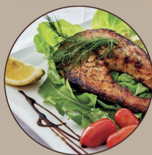
Posta de Salmão Grelhada Grilled Salmon