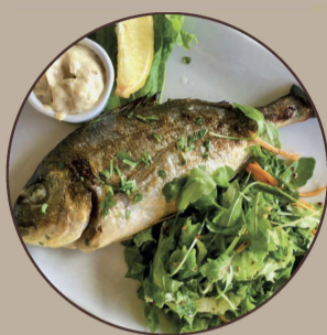
Dourada Golden Bream