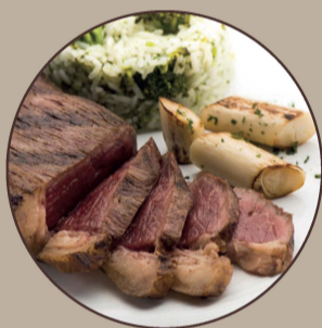
Picanha Grelhada Grilled Rump Cover