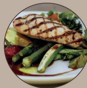
Peito de Frango Grelhado Grilled Chicken Breast