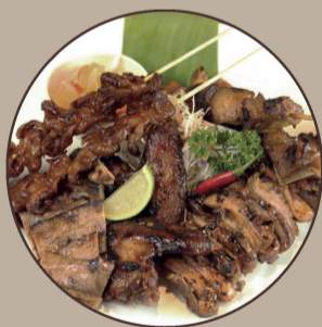
Grelhada Mista Mix of Grilled Meat