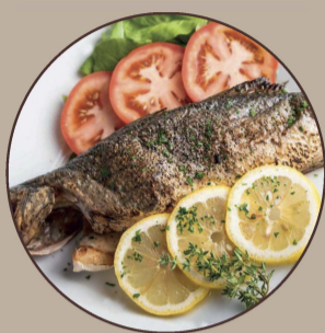
Robalo Sea Bass